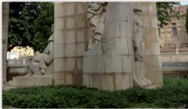
Fig. 8.- Diferents imatges que mostren el soterrament que ha anat patint el monument amb cada remodelació del jardí.