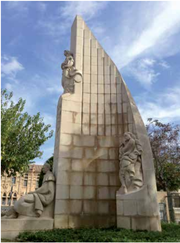
Fig. 4.- Imatge actual del monument al mestre Serrano.

barret de palla i descalç, però amb garramatxes 10 . A la mà dreta porta una garba d'arròs i a l'esquerre un tallant 11 . Aquesta figura és molt similar a la dels camperols que veiem en el relleu sobre el camp valencià que Vicent Beltrán va fer per a l'ateneu Mercantil de València en 1953.