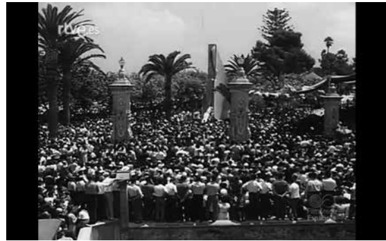
Fig. 7.- Una multitud observa la inauguració del monument al passeig de l'estació. Fotograma del NO-DO.

Gràcies a dos expedients, un d'ells conservat a la Biblioteca Suecana 18 , —que que va aplegar per donació 19 — i l'altre a l'Arxiu Històric Municipal de Sueca —que forma part del fons municipal 20 — podem veure la cronologia d'aquesta problemàtica. Comencem amb l'expedient de la biblioteca.