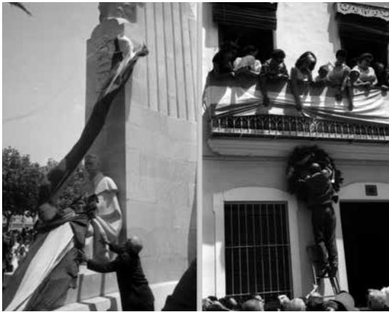
Fig. 6.- Moment de la inauguració al parc de l'Estació i col·locació d'una corona de fulles de llorer a la casa natal del mestre Serrano.